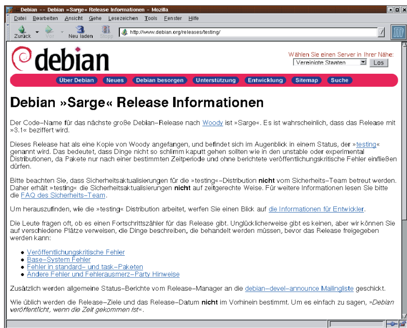
Abbildung 3: Informationsseite über die nächste Debian-Version Sarge. Den Release-Termin mussten die Entwickler wegen immer neuer Unstimmigkeiten innerhalb des Projekts bereits mehrmals verschieben.