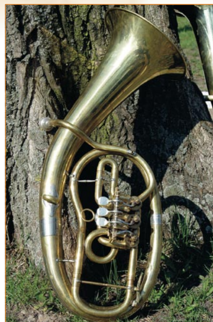
Figura 4: Tem uma reclamação? Fale com a gente!

Quanto às imagens, estamos fazendo esforços para traduzi-las sempre que relevante. Infelizmente, a taxa de internacionalização dos programas não é tão alta quanto você diz e muitas vezes o que realmente importa não é o texto em um menu no topo da imagem (geralmente pequeno demais para ser lido), mas o conteúdo (uma imagem em uma janela do Gimp, um site na Web, etc). Nesses casos, optamos por manter o original em inglês. Note, entretanto, que no texto dos artigos estamos publicando, ao lado do nome de menus e comandos em inglês, sua tradução para o português sempre que disponível.