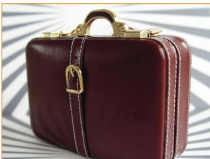
Figura 3: A migração dos dados ao reinstalar o sistema é uma preocupação de nossos leitores.

Parabéns pela matéria sobre o GnuCash (quinta edição, página 28). Uso o Linux e adotei o KDE como ambiente desktop, que está todo “personalizado”. Vou ter que formatar o computador e perder tempo refazendo essas configurações, portanto sugiro um artigo sobre como fazer um “backup” do ambiente, incluindo email,