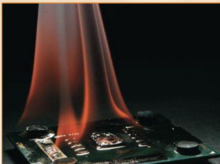
Figura 2: Um erro de ACPI pode fazer a CPU parecer mais quente do que realmente está.

incorretamente a temperatura do processador. Experimente desabilitar o daemon ACPI com o comando /etc/init.d/acpid stop e veja se o problema desaparece. Infelizmente, você perderá a capacidade de monitorar o nível da bateria.