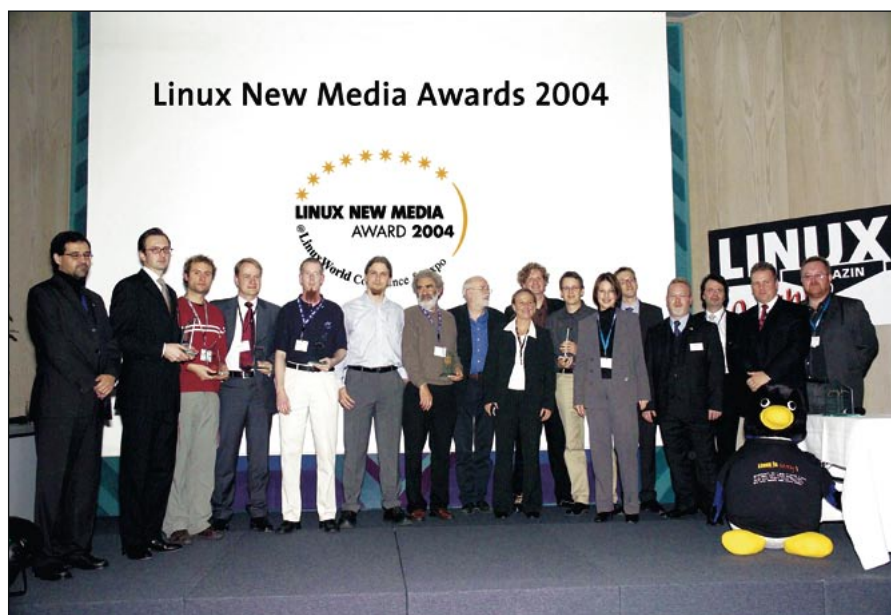
Figura 1: Alguns jurados e os vencedores após a premiação.

Os membros do júri deram o merecido prêmio de “A Melhor entre as Novas Distribuições Linux” ao projeto norueguês Skole Linux ( http://www.skolelinux.org ). O Skole Linux foi desenvolvido especialmente para o uso escolar.